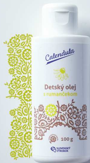
Detský olej s obsahom rumančeka