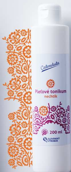
Pleťové tonikum s obsahom výťažku z nechtíka lekárskeho