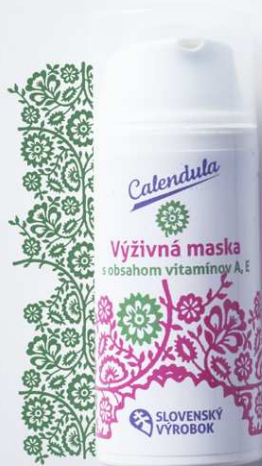
Výživná maska s obsahom vitamínov A, E