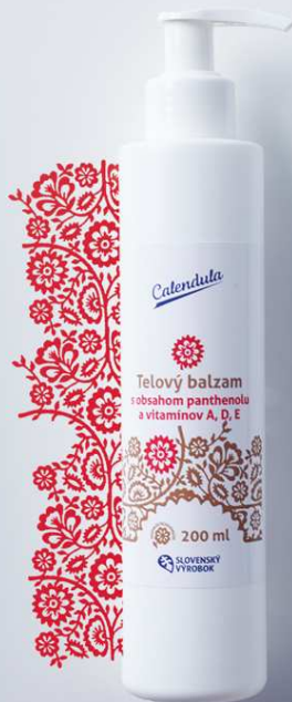
Telový balzam s obsahom panthenolu