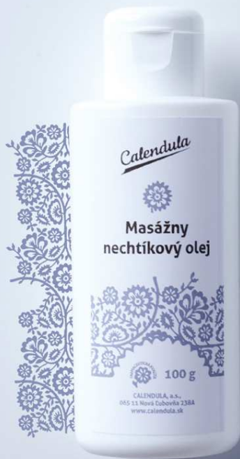
Masážny olej nechtíkový