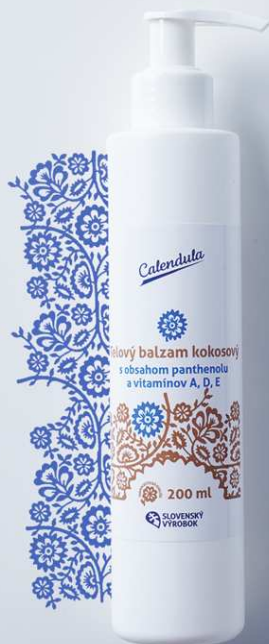
Telový balzam kokosový