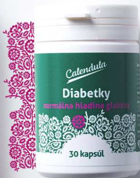
Diabetky kapsuly napomáhajúce zniženiu hladiny cukrov v krvi