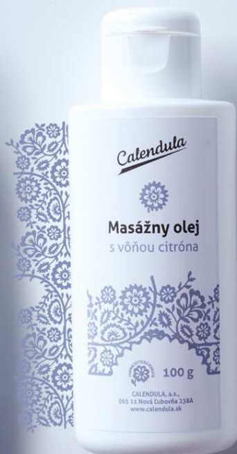
Masážny olej citrónový