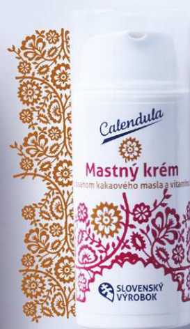
Mastný krém s obsahom kakaového masla a vitamínu E