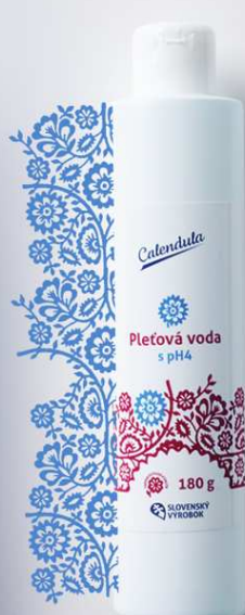
Pleťová voda s pH4