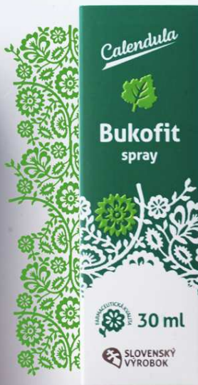
Bukofit spray na ošetrovanie ďasien