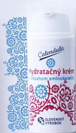
Hydratačný krém s obsahom aminokyselín