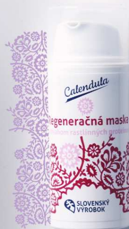
Regeneračná maska s obsahom rastlinných proteínov