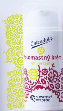
Polomastný krém univerzálny