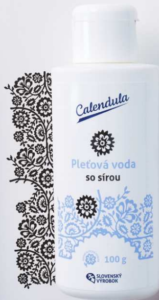
Pleťová voda s obsahom síry