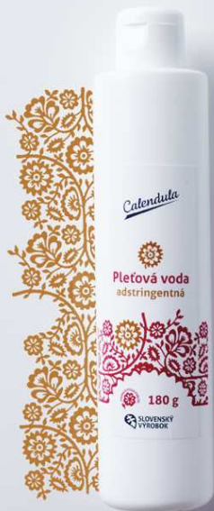
Pleťová voda adstringentná