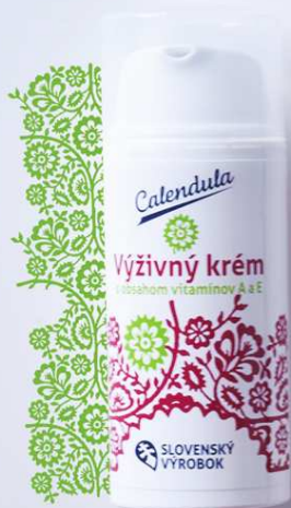
Výživný krém s obsahom vitamínov A, E