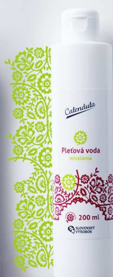
Pleťová voda micelárna