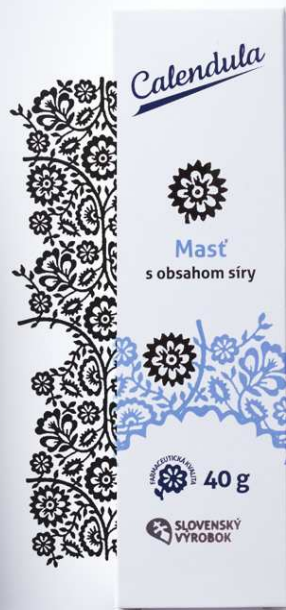
Masť s obsahom síry na aknóznu pleť