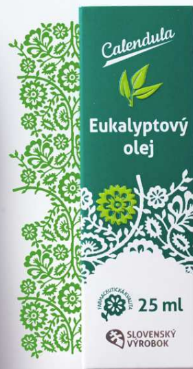
Eukalyptový olej na inhaláciu pri ochorení dýchacích ciest