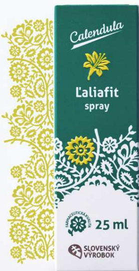
Laliafit spray na nohy