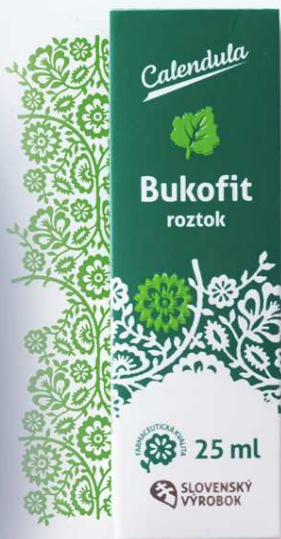
Bukofit roztok na ošetrovanie ďasien