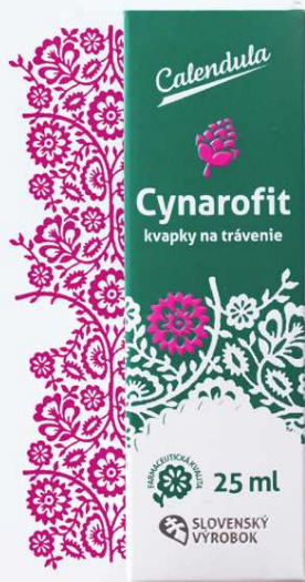
Cynarofit kvapky na trávenie