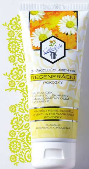
Zmäkčujúci krém na regeneráciu pokožky