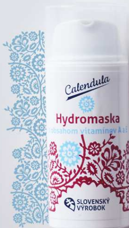
Hydromaska s obsahom vitamínov A, E