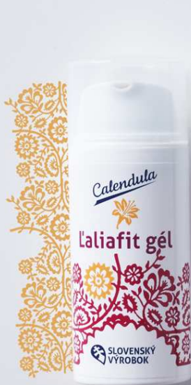
Laliafit gél pomáha pri akné, popáleninách a poštípaninách hmyzom

Rad kozmetiky so sírou je určený pre problematickú a aknóznu pleť, ktorá sa vyznačuje poruchami produkcie mazu. Účinná zložka síra podporuje tvorbu kolagénu a keratínu, je ideálnym pomocníkom pri liečbe akné, ekzémov i ochorení pohybového aparátu. Látky v produktoch pre starostlivosť o pokožku tela pomáhajú spevniť kontúry tela, podporujú pružnosť pokožky a pôsobia proti prirodzenému procesu starnutia.