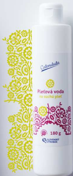
Pleťová voda na suchú pleť