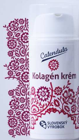
Kolagén krém s obsahom rastlinných proteínov a vitamínu E

Ošetrujúce prípravky pleť hydratujú a vyživujú. Krémy udržiavajú pleť pružnú, značne ju zjemňujú, rozjasňujú a spevňujú. Majú tiež vlastnosť ochrániť ju pred znečisteným vonkajším prostredím a počasím. Peeling odstraňuje odumreté bunky a umožňuje pleti lepšie dýchať. Vyčistená pleť lepšie vstrebáva účinné látky. Masky dopĺňajú účinky krémov a dodávajú pleti viac výživných látok. Naše pleťové masky nie je potrebné zmyvať a môžete ich nechať pôsobiť na pleti ako nočný krém.