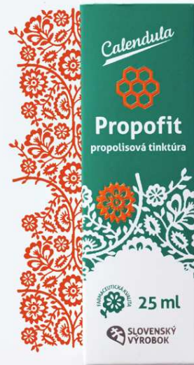
Propofit propolisová tinktúra