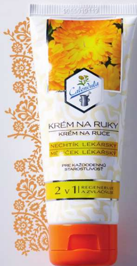
Krém na ruky s obsahom výťažku z nechtíka lekárskeho