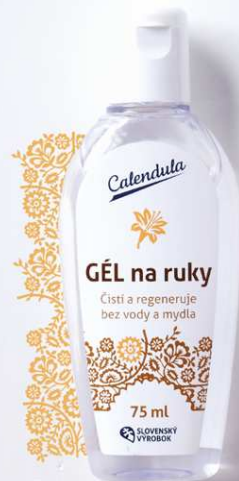
Gél na ruky na čistenie a regeneráciu